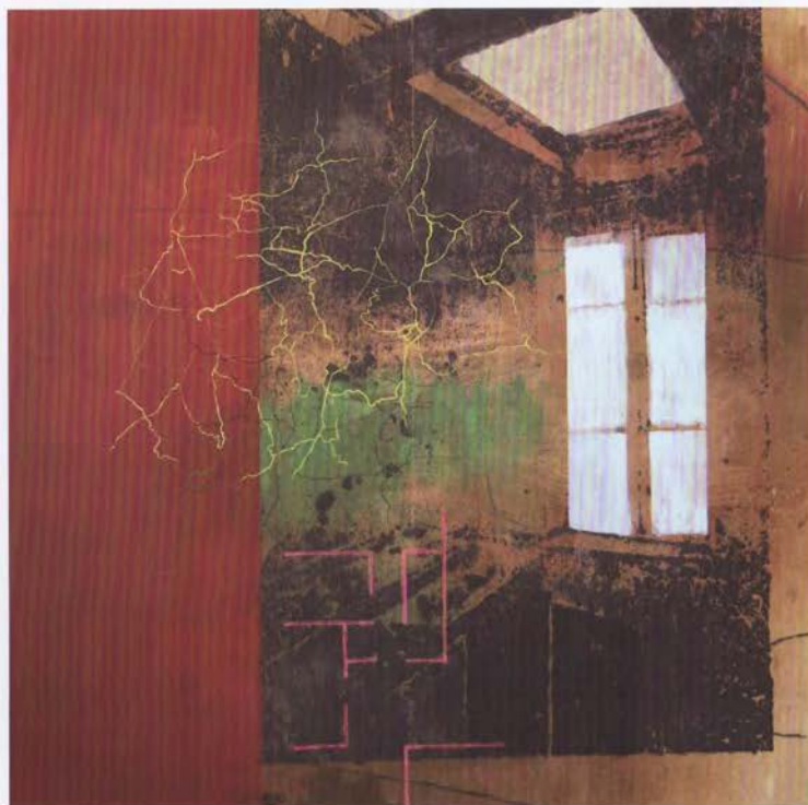
Balcó , Sèrie "Vestigis", 2009 Tècnica mixta sobre fusta 120 x 120 cm

que l'artista mantindrà viu." Aquest mateix any va exposar la seva obra "Translate. Traduir, traslladar" a la secció Tentaciones, Estampa 2010, Feria Internacional de Arte Múltiple Contemporáneo, Madrid. Una instal·lació amb impressió digital i intervenció mural amb làtex de dimensions variables. El projecte, segons l'artista, consistia a recollir, crear, recrear, arxivar i comunicar fotografies, vídeos i testimonis orals sobre un patrimoni natural i cultural vinculat al bosc i a la vida al bosc que, després d'haver estat eix de l'activitat humana a la zona des de períodes prehistòrics, està a punt de desaparèixer.