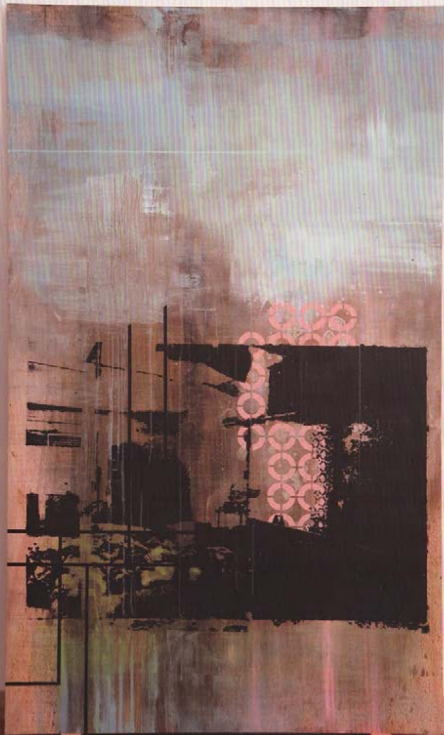
Bany , Sèrie "Vestigis", 2010 Tècnica mixta sobre fusta 200 x 120 cm